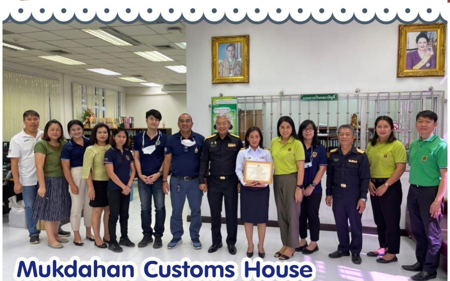
Mukdahan Customs House